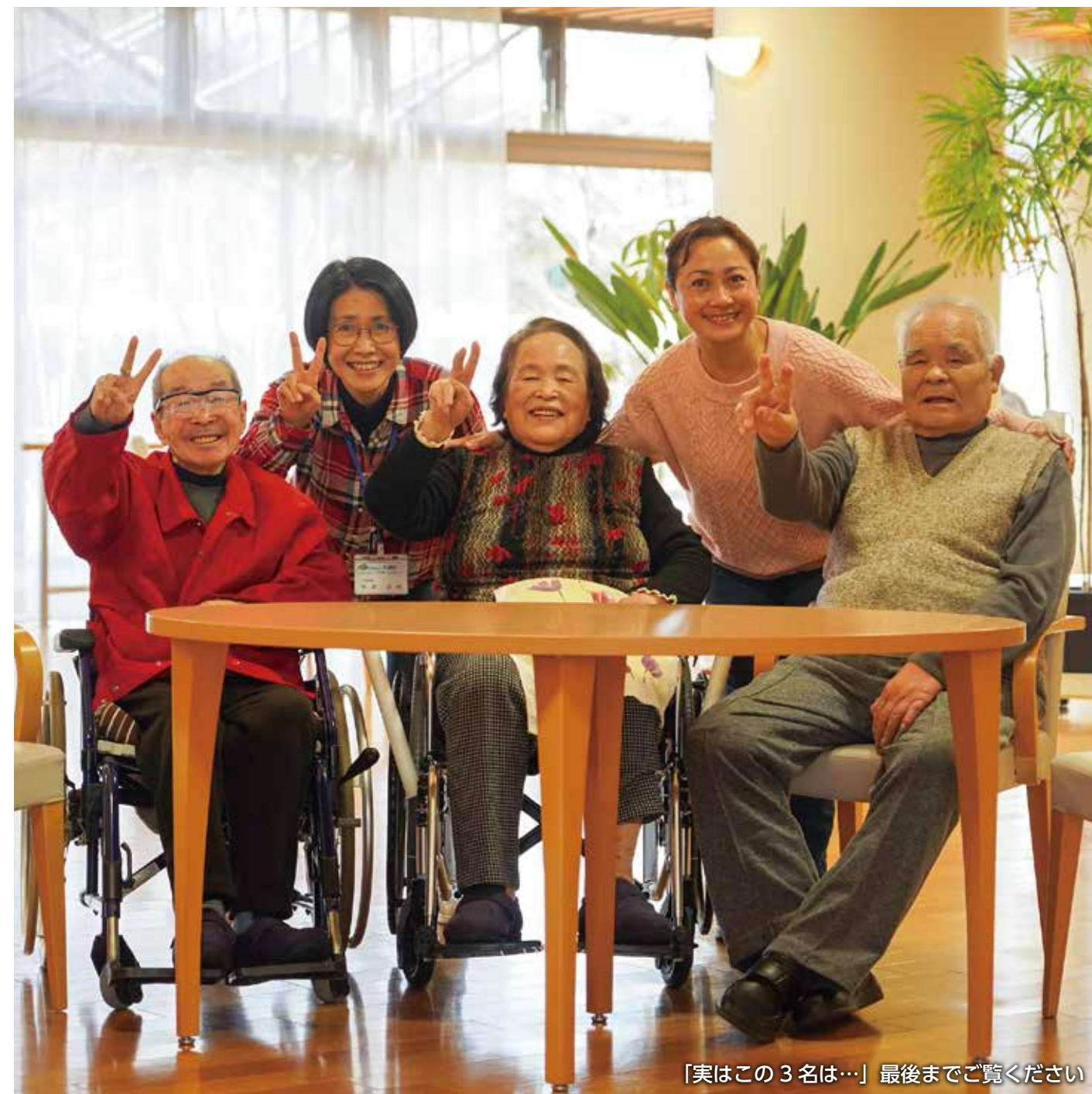
「実はこの3名は…」最後までご覧ください